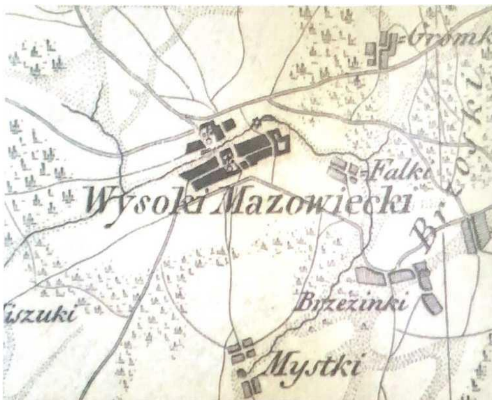
Wysokie Mazowieckie na mapie pruskiej Textora Nowe Prusy wschodnie z 1806 roku.