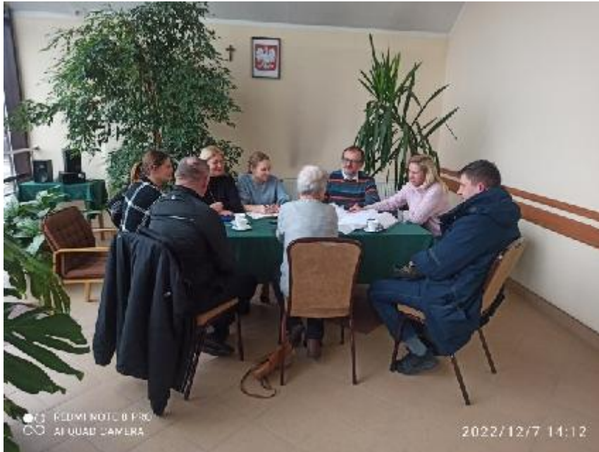
Zdjęcie 1. Posiedzenie Komitetu Rewitalizacji dot. projektu uchwały projektu uchwały Rady Miasta Wysokie Mazowieckie w sprawie zmiany obszaru zdegradowanego oraz obszaru rewitalizacji w Mieście Wysokie Mazowieckie w dniu 7 grudnia 2022 r.

W spotkaniu konsultacyjnym w dniu 7 grudnia 2022 r. wzięły udział 3 osoby oraz po 1 przedstawicielu Urzędu Miasta Wysokie Mazowieckie oraz Wykonawcy. W przypadku spotkania przeprowadzonego przy wykorzystaniu środków komunikacji elektronicznej w dniu 14 grudnia 2022 r. w godz. 14.00 -15.00 odnotowano brak osób biorących w nim udział, za wyjątkiem przedstawicieli Urzędu Miasta Wysokie Mazowieckie (1 os.) oraz Wykonawcy (1 os.).